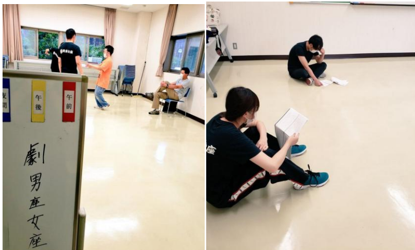
新しい台本、熟読中「字むずいな、、、」

そして、先日13日は、「劇団版 炎のシグナル」初めての読み合わせを行いました。 はじめて手にする台本をそれぞれ読み、いざ！と読み合わすんですが、やはり初回。先生も頭を抱える場面もあり、、、これから見違えるように成長するよう頑張らねば！ また、この日は、はるばる白浜から新メンバーが来てくれました！ がつつり経験者の方で、今日一日でも教えて頂くことがたくさんありました！過去のお話も聞きましたが、初心者の私からすれば、どの話もまぶしい！すばらしい！ これから一緒に舞台を作り上げていく頼もしい仲間が出来て、とても嬉しく思いました！ もう一人、見学者の方もいらっしゃいました！見に来て頂いてありがとうございます。 劇男座女座はいつでも見学自由ですので、お気軽にお越しくださいね^^