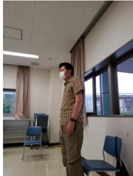
団長挨拶 決意も新たに！